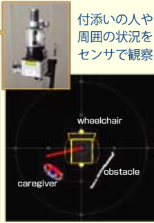
付き添いの人や周囲の状況をセンサで観察

車椅子の方が出かけるときは、付き添いの方と一緒に出かけることが多いのではないのでしょうか。開発した車椅子は、カメラやレーザセンサを使って付き添いの人を観察することで、特別な操作をしなくても、自動的に横に並んでついてきてくれます。