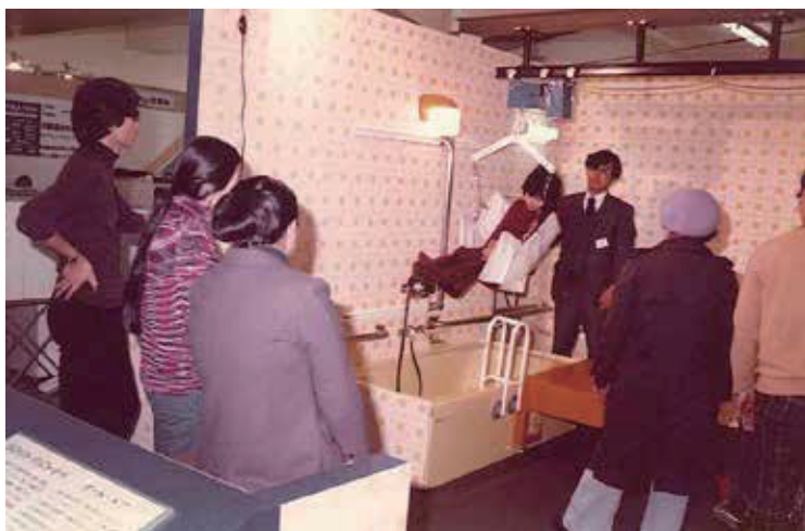
老人・身体障害者のモデルルーム