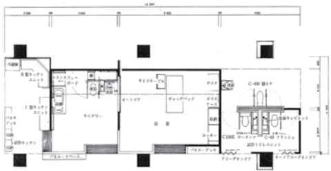
モデル・ルーム平面図